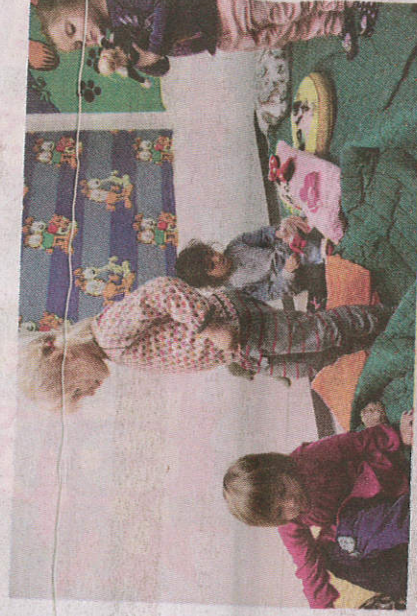
I projektet #tillsammans2015 utmanar de andra skolor och förskolor att samla in pengar som ska gå till FN:s hjälporgan UNCHR.

Det känns bra att vara här. Det var spännande innan vi åkte, men nu är det bara kul. Det är viktigt att samla in pengar och vi har sålt chokladbollar.